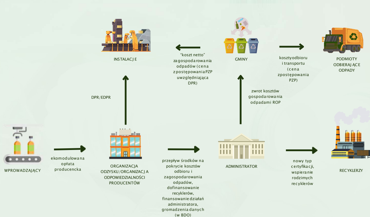
Schemat 2. Przepływ środków finansowych w ramach dofinansowania systemu komunalnych odpadów opakowaniowych zebranych poza systemem gminnym (nie w systemie kaucyjnym). Odpady przemysłowe rozliczane analogicznie.